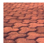
Bricka 12 Canela

•Produtos produzidos segundo a norma Brasileira ABNT NBR 9781