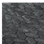
Bricka "S" Grafite